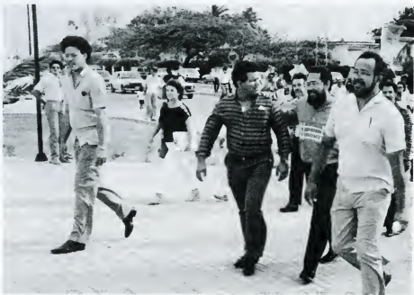
Lidernan sindikal na selebrashon di 1 di mei

“Awor, na e momento aki, tin atakenan fuerte riba e lei di retiro. Entre otro na Korsou nos por mira ku tin diskushonnan fuerte